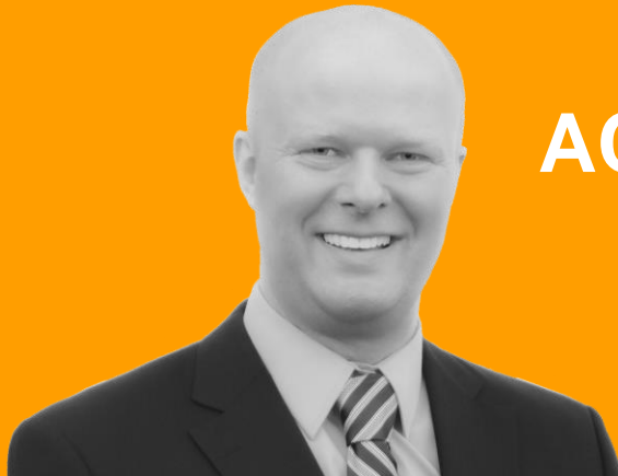
Michael Haak Beratung