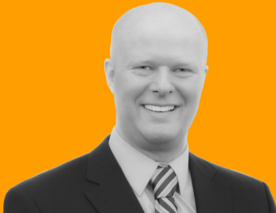
Michael Haak Beratung